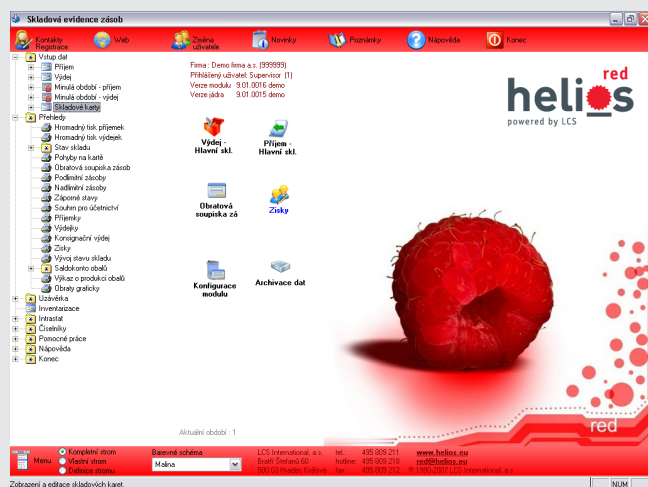
popisek k obrazovce